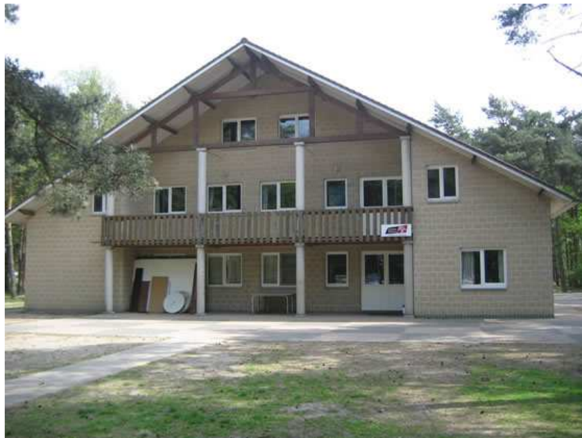
Foto: De Bosuil, het hoofdgebouw op het Jeugd- en Vakantiecentrum.

De eerste keer is altijd spannend. Bij WERVEL is dat niet anders. In 1996 was het voor velen een groot vraagteken. In 1999, bij de tweede editie, volgde de bevestiging. En ook de editie van 2005 was een schot in de roos. Wij zijn ervan overtuigd: dit groots kamp van Chiro Arendonk Centrum is een prachtig evenement. Iedereen die onze chiro een warm hart toedraagt, doet er goed aan zijn koffers al klaar te zetten. In 1996 gingen we met 218 op WERVEL. In 1999 deden we daar een schepje bovenop en in 2005 waren er 308 deelnemers. Dit jaar hopen we nog meer mensen te overtuigen deel te nemen aan dit unieke tentenkamp. WERVEL 2010 heeft plaats van woensdag 25 augustus tot en met zondag 29 augustus . We strijken neer in Hechtel-Eksel, in Limbuuuuurg dus. Bij de keuze van de kampplaats waren drie dingen belangrijk: een ruime locatie, een verzorgd sanitair gedeelte en een kampplaats niet ver van de deur.