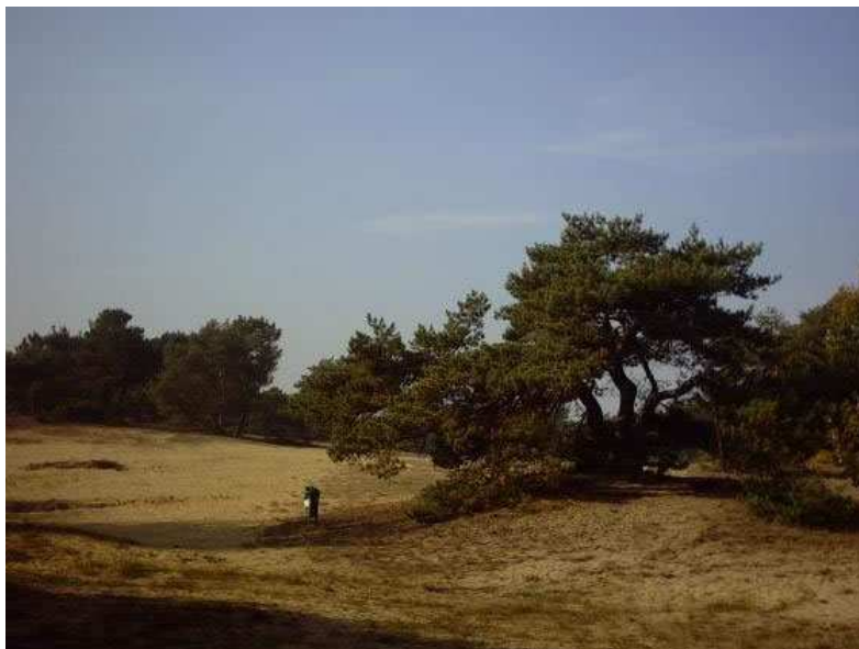
Foto: De Hechtelse Duinen, het grootste (!?) natuurfenomeen van Limburg.

De naam van onze kampplaats is Jeugd- en Vakantiecentrum (JVC) . Wie zich niet kan inhouden, surft best meteen naar www.chiro-arendonk.be/wervel ( Kampplaats en dan JVC Hechtel ) De kampplaats is gelegen aan de Lupinestraat 1 in 3940 Hechtel-Eksel . Naar goede WERVEL-traditie palmen we het hele domein in. JVC is een bosrijk gebied dat grenst aan het militaire domein. Het terrein is ongeveer 7,5 hectare groot. Naast het hoofdgebouw met conciërgewoning (De Bosuil) staan er nog drie gebouwen (Korhoen, Wulp en Grasmus). Naast voldoende tentengrond zijn er ook een speeltuin, Finse piste ( ja ja, pak die loopschoenen maar mee ) en een skatepark. Een stuk achter de bivakplaats zijn er zowaar... zandduinen. Dwars door JVC loopt een openbaar wegje voor voetgangers en fietsers.